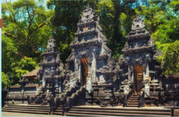
Goa Lawah – 15 000 Rps