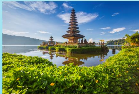
Pura Ulun Danu Tempel –75 000 Rps