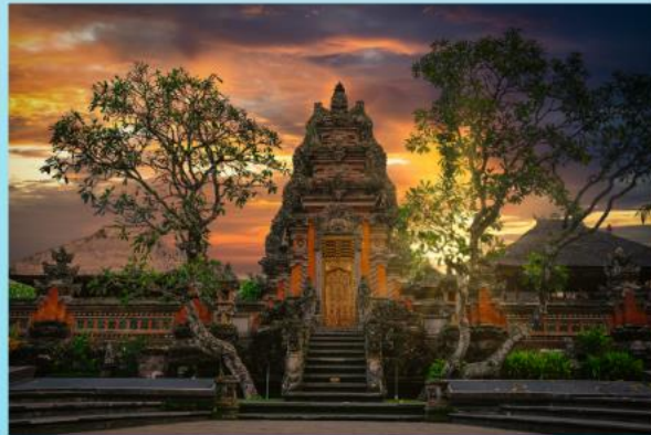
Ubud Culturele hoofdstad